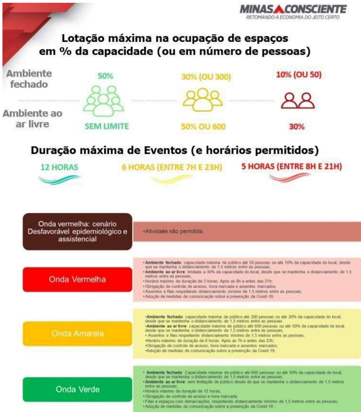
Figura 1 – Regrimentos dos eventos segundo as ondas do Plano Minas Consciente (MINAS CONSCIENTE, versão 3.9 – 19/07/2021)