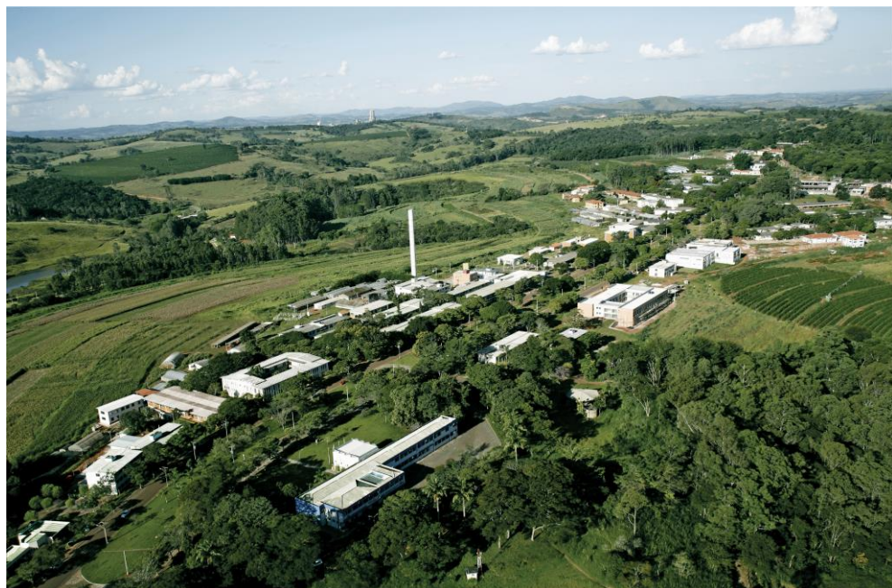
Vista aérea do campus da Ufla