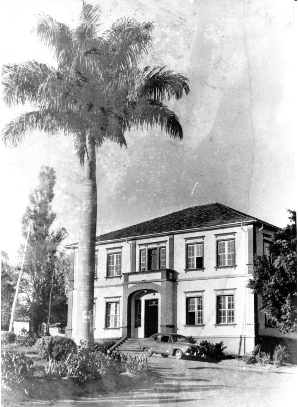
Antigo prédio da administração da ESAL - hoje Museu Bi Moreira