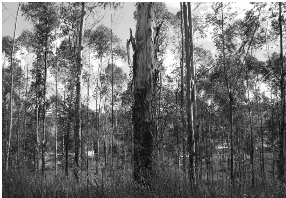
Plantação de Eucalipto

Em 1980 foi aprovado o Projeto para a implantação do curso de graduação em Engenharia Florestal , com oferta de 20 vagas anuais.