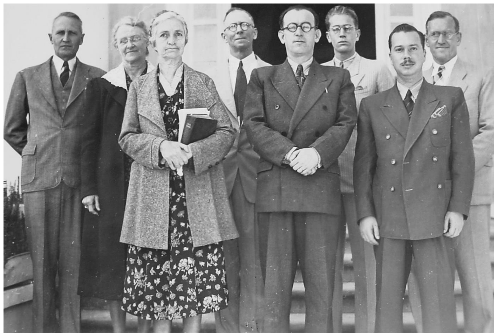
Funcionários da Antiga Escola agrícola de Lavras