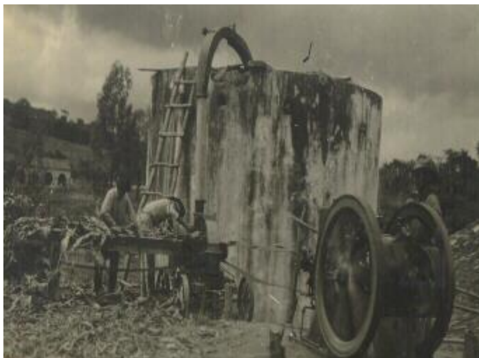
Primeiro Silo Aéreo em funcionamento

O curso de Zootecnia foi o 2º curso superior implantado na ESAL em 1975, concomitantemente ao curso de Engenharia Agrícola, com oferta de 25 vagas semestrais. Levou-se em consideração a localização da ESAL, em região tradicionalmente