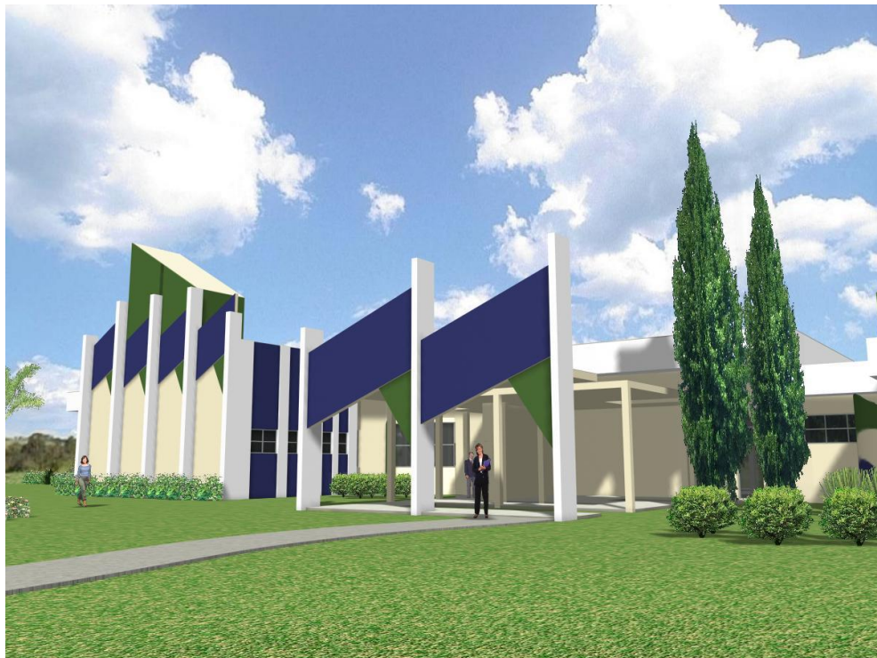
Projeto virtual do novo Restaurante Universitário

Novos cursos estão previstos, inclusive no período noturno, permitindo o aumento de eficiência no uso da estrutura da universidade e a ampliação da relação com diferentes segmentos da sociedade. A UFLA passa a atuar em novas áreas do conhecimento, depois de consolidada como referência nas Ciências Agrárias.