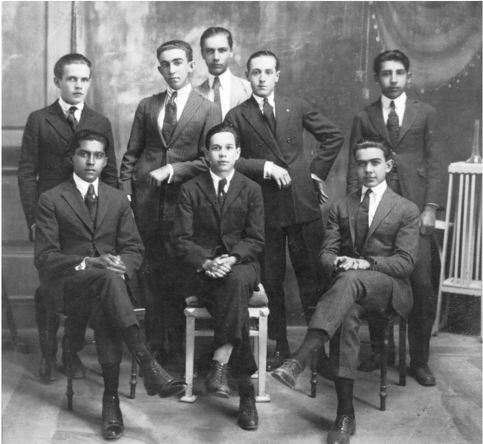
Alunos do primeiro ano de Agronomia da Esc. Agrícola de Lavras

A história do curso de Agronomia inicia-se com a saga no Brasil do Reverendo Samuel Rhea Gammon, missionário presbiteriano e americano que chegou ao País em 1889, para incrementar o corpo docente do Instituto Internacional de Campinas.