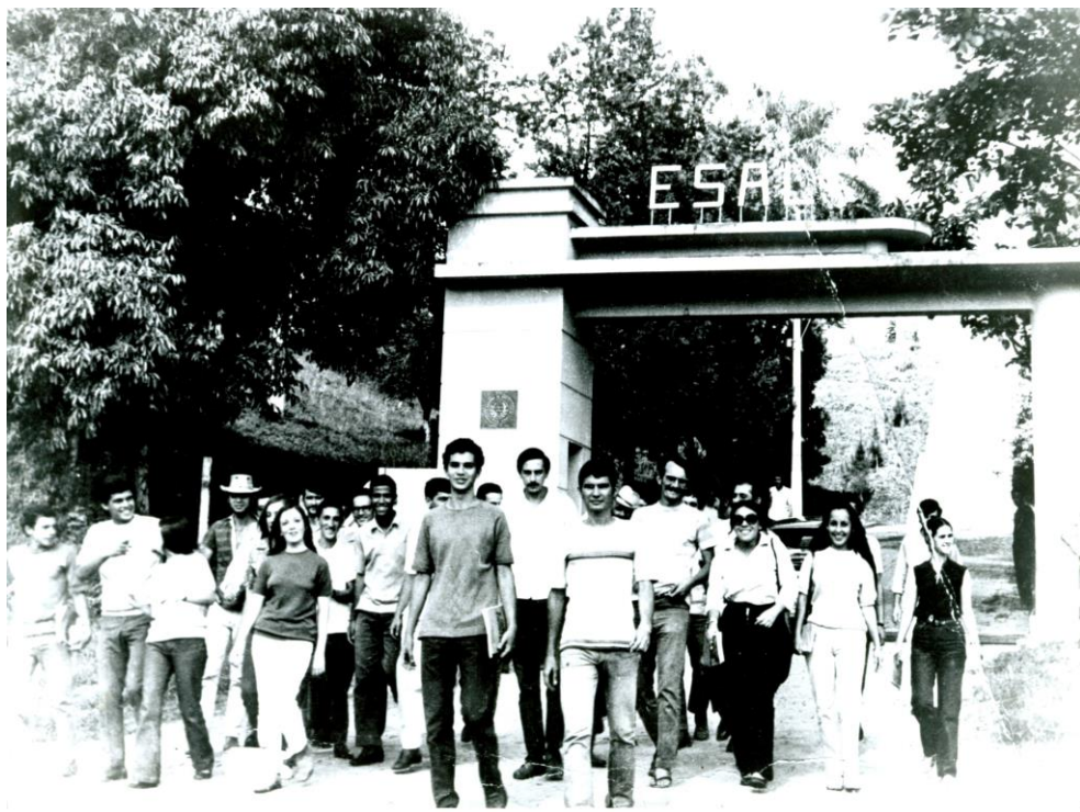
Alunos da ESAL

A origem do curso de Administração remete ao ano de 1976, com a criação do curso de Tecnólogo em Administração Rural , com 30 alunos. A concepção do curso se deu por meio de diagnósticos e observação que a empresa deveria ser estudada quanto à composição dos seus elementos de custos, à alocação dos recursos e os níveis tecnológicos empregados. Ao mesmo tempo, foram promovidos estudos visando a conhecer o homem rural e suas atitudes diante das inovações tecnológicas. Nesse sentido, foi observada a necessidade de se criar um curso visando à formação de técnicos de nível superior em curta duração, na área de administração rural, ressaltando que um curso dessa natureza enquadraria-se na política de estabelecimento de cursos de curta duração estabelecida pelo MEC.