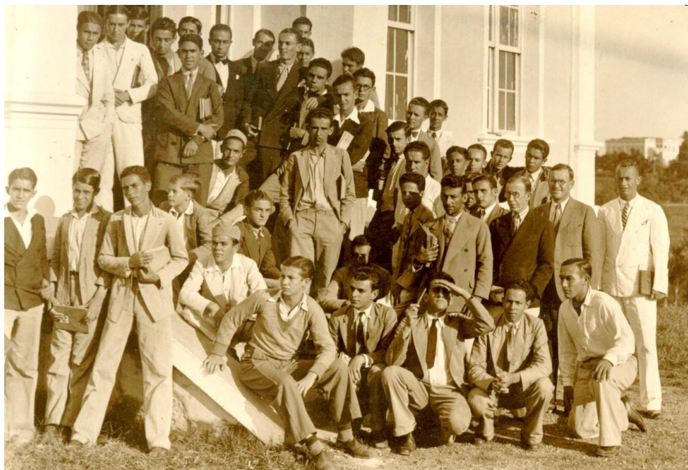
Alunos da Escola Agrícola de Lavras (EAL)

Os alunos do Curso Agrícola correspondiam aos anos do Curso Ginásial. Os alunos, porém, que tivessem idade suficiente mas que não estivessem preparados para o estudo das outras matérias do primeiro ano, poderiam desde o princípio tomar parte nos trabalhos práticos.