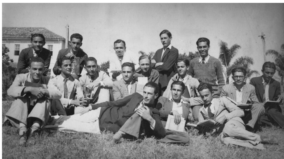
Grupo de alunos da ESAL na década de 40