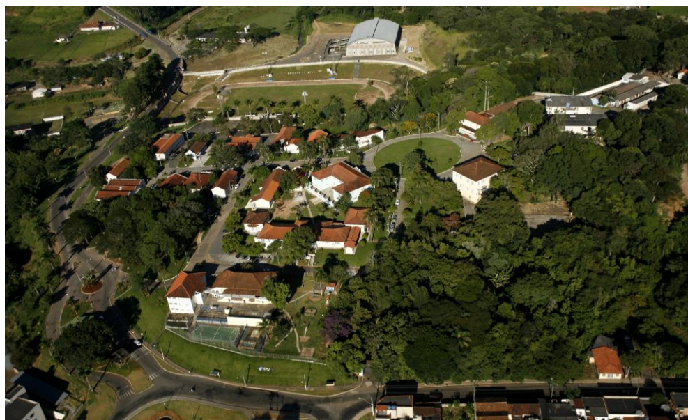
Vista aérea do campus histórico da Ufla